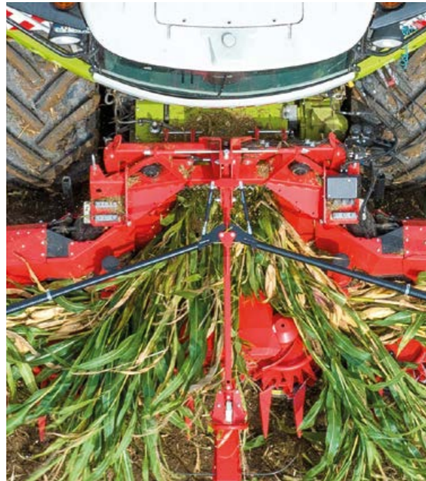
完美捆扎 植株流确保切碎长度精确

均匀的草料结构始于割台。只有当饲料捆扎整齐地送入青贮收获机时，才能最大程度地减少过长部分和枯叶的比例。