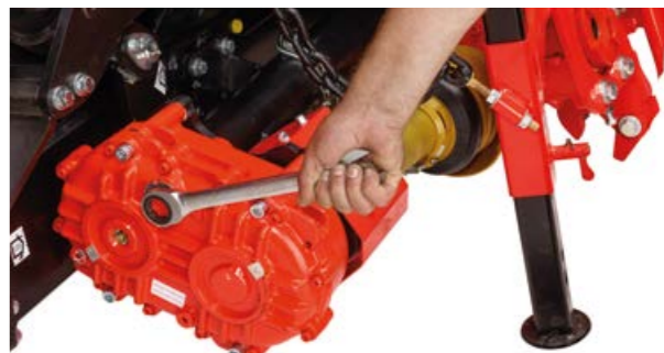
凭借四档多速变速器， 无论有无可变割台驱动器，均可根据各切割长度理 想地调节割台速度。

倾斜输送塔轮和特殊形状的新底板将饲料均匀地分布在 整个宽度上，使其能均匀地送入青贮收获机的所有部 件。无一遗漏！