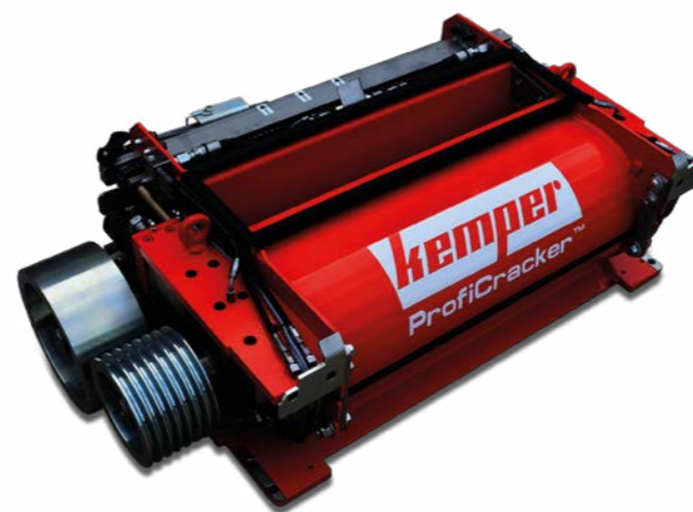
Profiクラッカー -鋭い噛みつき

各メーカーの自走式フォーレイジハーベスター用大径ドラムヘッダー。高さ3.50m以上のトウモロコシ、ススキなどに最適です。