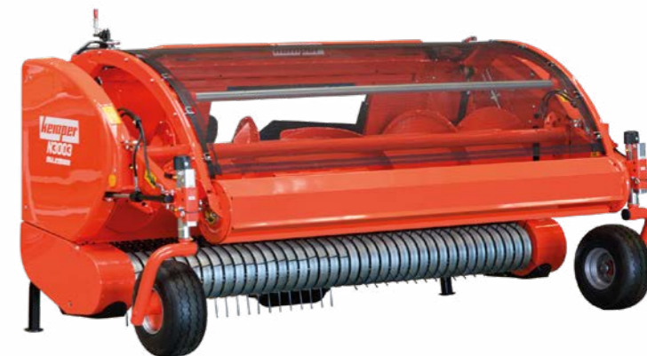
ピックアップ -賞コレクター

高い信頼性でトラブルのない収穫。酪農場向けの長い切断長でも、バイオガス設備用の短い切断長でも、Kemper ProfiCracker™は常に完璧なソリューションを提供します。