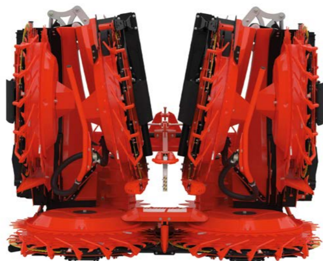
大径ドラムヘッダーシリーズ -背の高い作物向け

各メーカーの自走式フォーレイジハーベスター用小径ドラムヘッダー。高さ3.5m以内のトウモロコシやホールクroppサイレイジなどの収穫に最適です。