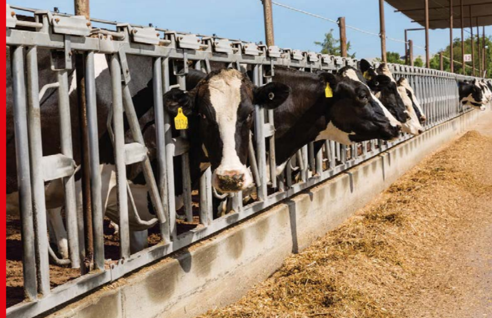
酪農場でもバイオガス施設でも

Kemperは、収穫が順調に進み、お客様が落ち着いて実際の仕事と取引先に集中できるように全力を尽くします