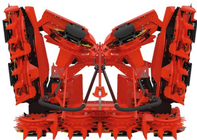
小径ドラムヘッダーシリーズ -コンパクトタイプ

各バージョンの詳細については、弊社のウェブサイト www.kemper-stadtlohn.de をご覧ください。