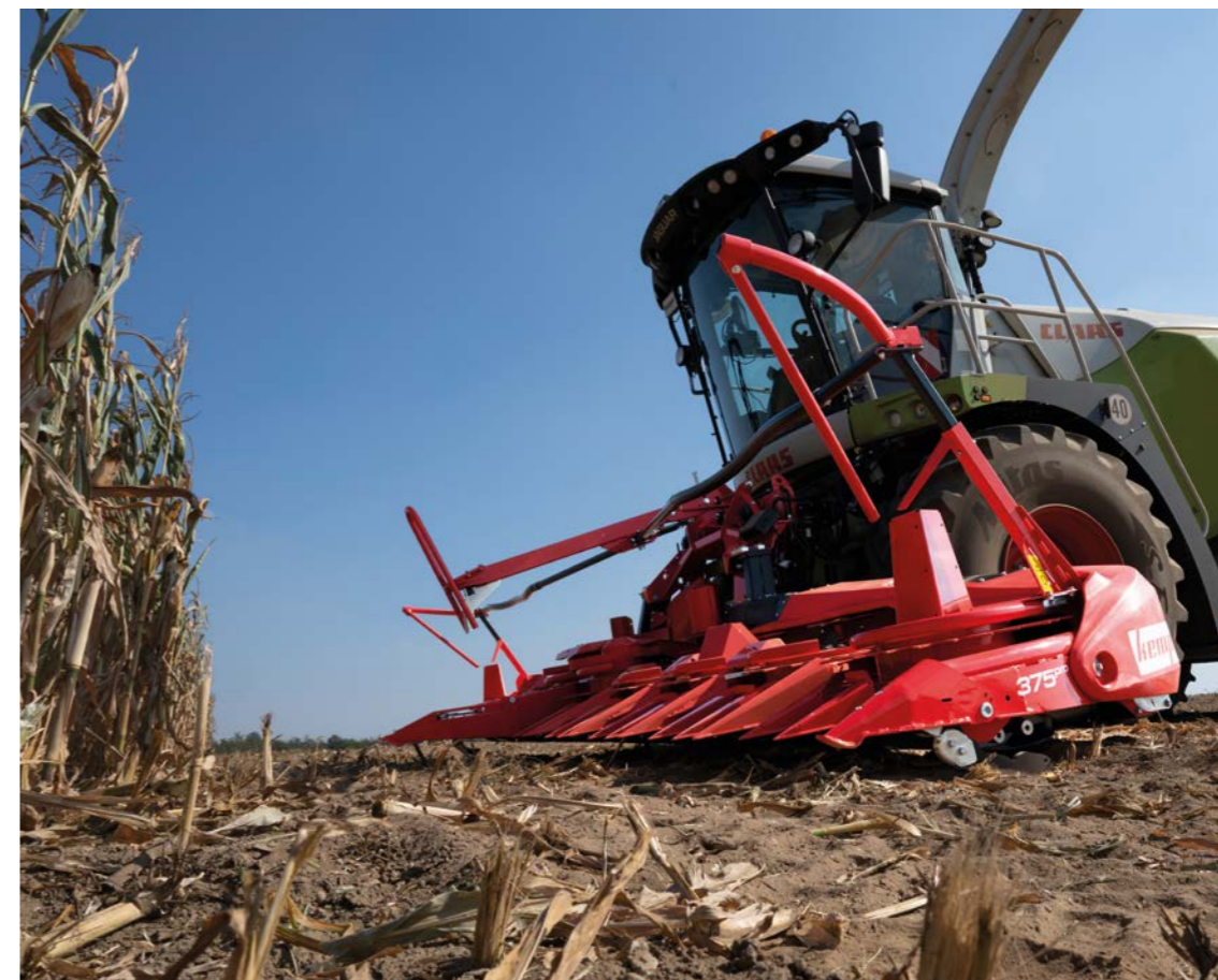
背の低い乾燥したデントコーン

キャビンルーフの高さに達するような特に背丈が高く、高収量のデントコーンを栽培されている場合、400 PRO シリーズもお勧めです。